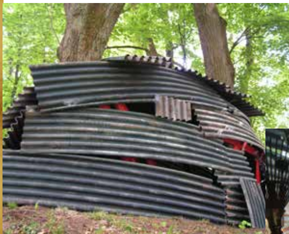
«La Folie» - Daniel Depoutot Oeuvre exposée dans les jardins de Wesserling depuis Jardins de Cabanes (2011)

Le projet de conception, dessins et documents fournis resteront la propriété intellectuelle des artistes. Cependant, les visuels pourront être diffusés dans un but de valorisation de l'œuvre et d'information. En aucun cas il n'en sera fait un usage commercial. Les photos réalisées par l'organisateur une fois l'œuvre sélectionnée et exposée pourront être utilisées, libres de droit, à des fins de promotion du site. Les œuvres d'art restent la propriété de leur auteurs, qui pourront les récupérer à la fin de l'événement, en prenant contact avec l'organisateur.