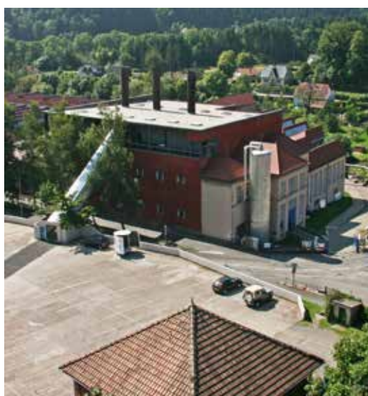
La Grande Chaufferie